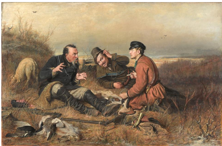
Василий Григорьевич Перов. «Охотники на привале». 1871. Государственная Третьяковская галерея, Москва.